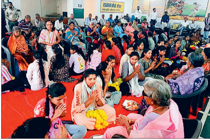
कार्यक्रम में शामिल हुए हजारों